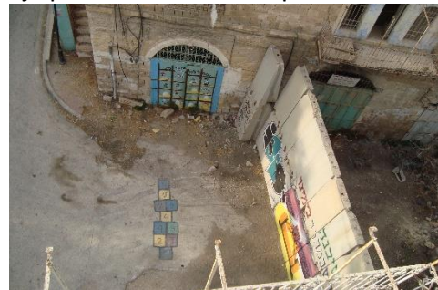
Uitzicht vanuit het CPT-huis in Hebron 1

Permanente controleposten, tijdelijke controleposten, wegversperringen en andere fysieke belemmeringen worden allemaal door de staat Israël gebruikt om de bewegingsvrijheid van de Palestijnen te beperken en ervoor te zorgen dat de staat de controle over de Westelijke Jordaanoever behoudt. In al-Khalil zijn er meer dan 100 fysieke obstructies, zoals de controleposten en wegversperringen in de oude stad van al-Khalil. 22 hiervan zijn permanente controleposten. In de laatste 12 maanden zijn er drie versterkt en er zijn er nog eens drie gebouwd. Twee daarvan zijn gebouwd in de gesloten militaire zone in de Palestijnse wijk Tel Rumeida. Alle militaire controleposten worden bemand door gewapende Israëliische grenspolitie of soldaten. Sommige van deze militaire controleposten zijn om 10 uur 's avonds gesloten en pas de volgende ochtend om 6 uur 's morgens heropend, waardoor er 's nachts geen enkele beweging in deze gebieden mogelijk is. Het is niet ongevoen dat controleposten zonder voorafgaande kennisgeving worden gesloten, waardoor de Palestijnen gedwongen worden langere routes te nemen of gebieden voor onbepaalde tijd volledig af te sluiten voor de Palestijnen.